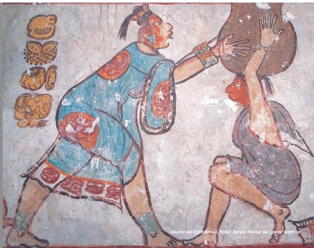
Mural de Calakmul, foto: Jorge Pérez de Lara / Raíces

Pensar en el rol de la mujer mesoamericana como gobernante en estos días es algo complicado ya que el proceso de mestizaje también abordó el machismo del conquistador europeo. Debemos recordar que los conquistadores no eran hombres del Renacimiento sino hombres que escapaban de la Edad Media por su deseo expansionista. Por esta razón, cuando se encuentran evidencias arqueológicas femeninas de aquellas sociedades nos causa cierta fascinación.