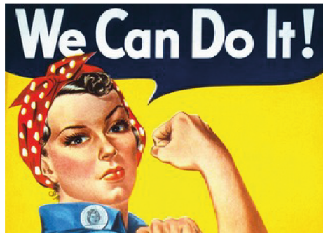
We can do it! (Podemos hacerlo) Frase del cartel diseñado por J.Howard Miller en 1943, como parte de una propaganda estadounidense para la empresa Westinghouse Electric.

condiciones de trabajo y la igualdad entre los sexos. Una lucha que sigue vigente, y que tiene mucho camino por delante, retos y sobre todo cambios que generen más conciencia y libertad de género.