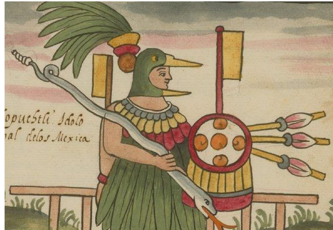
Huitzilopochtli con su xiuhcoatl o serpiente mística, también se le reconoce como el primer rayo solar que acabó con sus hermanos los Centzon Huitznáhuas (estrellas) y su hermana Coyolxauhqui (la luna) en la eterna lucha de la noche al día. Códice Tovar s. XVI.

Códice Florentino, Lib. III. Cap. I Traducción directa del náhuatl hecha por el Dr. Miguel León-Portilla.