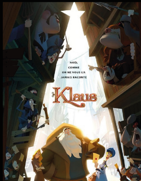
Klaus (Dir. Sergio Pablos, 2019)

Es navidad y dos amigas sexoservidoras en Los Angeles recorren la ciudad para tratar de cobrar una venganza del novio de Cindee-rella. La película es considerada como la primera en ser grabada totalmente con un celular. Una historia sobre la amistad, el mundo underground de las grandes ciudades y sobre la soledad que se vive en las grandes ciudades. Una comedia inesperada y muy entretenida.