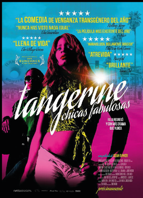
Tangerine: Chicas fabulosas ( Tangerine , Dir. Sean Baker, 2015)

Se trata de una cinta animada del gran creador Satoshi Kon. En donde nos cuenta la historia de tres vagabundos: un hombre mayor, un travesti y una adolescente, que en víspera de Navidad encuentran en un basurero a una bebé, y es así como recorren la ciudad de Tokio en busca de los padres de la bebé, gracias a unas pistas que encuentran. Una película conmovedora, llena de buenos sentimientos y mucha acción. Un filme fuera de lo común, para apreciar los buenos sentimientos que se hacen más latentes en esta época navideña.