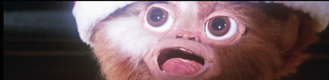
Gremlins (Dir. Joe Dante, 1984)

Una adorable e innovadora animación nos cuenta a partir de la visión de un burro y un ave, la historia del nacimiento de Jesús de Nazaret. Alejada de la visión religiosa, nos muestra desde una perspectiva distinta la visión de esta historia bíblica. Una gran película para chicos y grandes que nos recordará la historia en la cual se basa esta festividad.