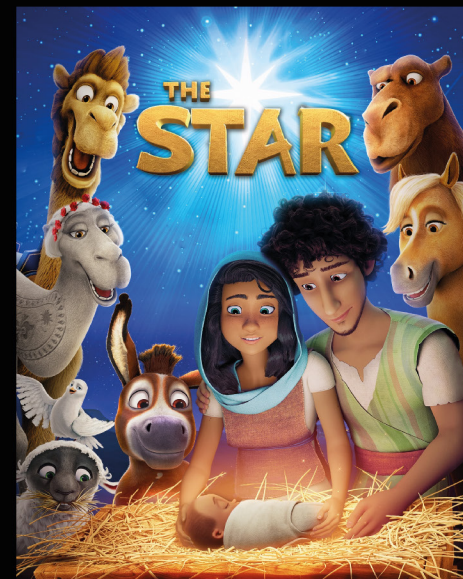
La estrella de Belén ( The star , Dir. Timothy Reckart, 2017)

La película revelación del 2019. Para muchos esta era la cinta de animación que debió haber ganado el Oscar en 2020. Dirigida por el español Sergio Pablos, nos cuenta una versión alternativa y conmovedora del origen de Santa Claus, y de cómo inició la tradición navideña de los regalos. Un excelente filme para toda la familia, donde la animación tradicional nos alegrará la Navidad.